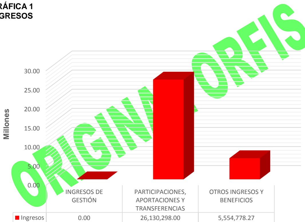
GRÁFICA 1 INGRESOS